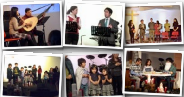
12月8日クリスマス礼拝のスナップ