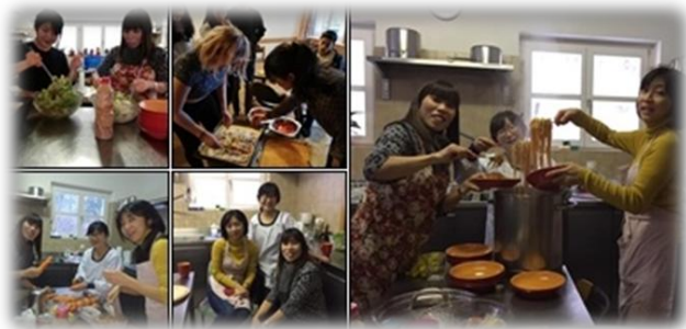
食事の準備・奉仕