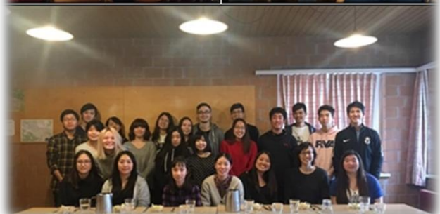
上：証し会（アキネ姉・チアキ姉） 下：集合写真