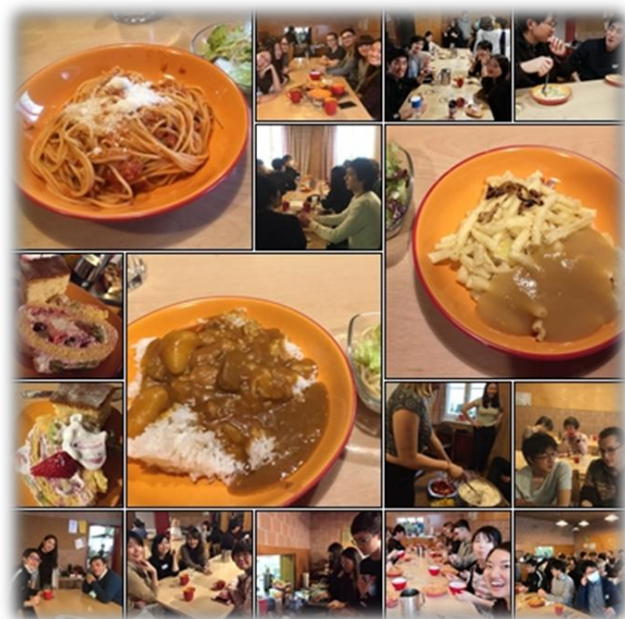
食事の恵み・良い交わりの時