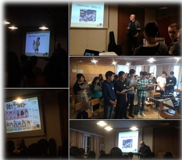
聖書の学び (賛美・メッセージ)

私はドイツ(デュッセルドルフ)で生活を始めてから2年半が経ちますが、スイスに訪れるのは今回初の機会でした。リトリートの聖書の学びでは、「あらゆる誘惑に対してどう対処して信仰生活を送れば良いか。困難から信仰によって立ち上がる事」の教えが与えられました。私の人生の変化は、2014年にヨーロッパで聖書に出会い、神を知り、イエス・キリストを救い主として受け入れてから。多くのクリスチャンと繋がり霊的に交わる中で。そうでなければ、「私は古いままの自分を抱えつつ自分の人生に意味が無い。」と思いつつ生きていただろうと思います。今、念願の海外生活をしていますが、健康や仕事の問題に遭い、精神だけで無く霊的にも窮地に陥りました。しかし、神は私の中で働いて下さり、解決の道も用意して下さいます。神の御心を全て知る事は出来ませんが、これからも神に祈り求めつつ、完全に委ねた生き方をしていきたいです。(ドイツより)