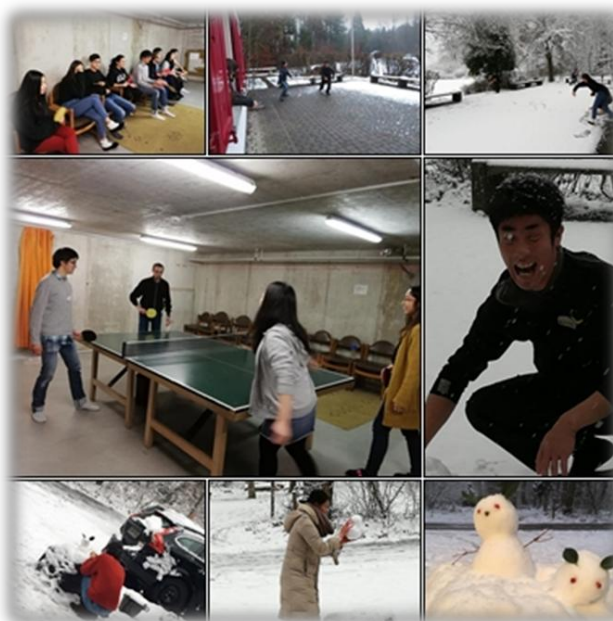
右：フリータイム（卓球・雪遊び）