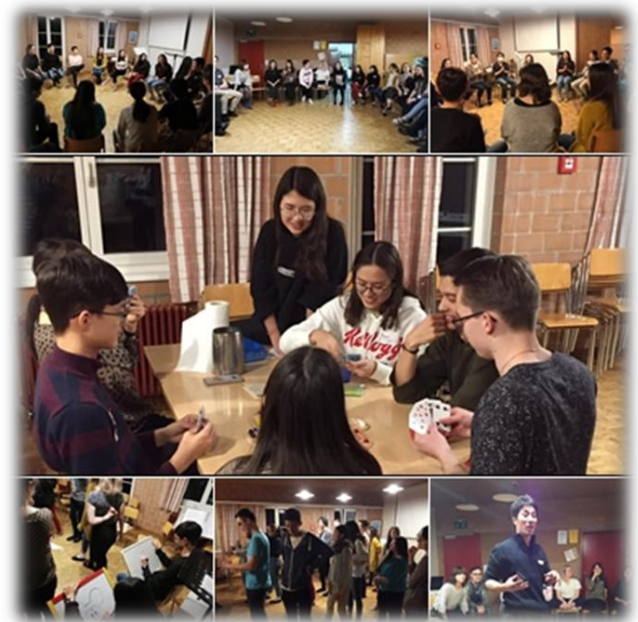
フリータイム (ゲーム)

私は初めてスイス・リトリートに参加しました。ヨーロッパ各国からたくさんの若い兄弟姉妹が集い非常に祝福された会でした。ヨーロッパにはたくさんの日本語教会があって各教会にそれぞれ青年がいますが、ほとんどの場合、教会に集う青年の数は2~5名ほどです。同じ教会に同世代がいないことで若い兄弟姉妹との交わりがなかなか持てない・そのことが原因で教会から離れてしまうという共通の課題があることを知りました。そういう意味でヨーロッパの30名以上の同世代のクリスチャン知り合えたことは非常に感謝です。これを機に若者の交わりの輪を広げられればと思います。(ドイツより)