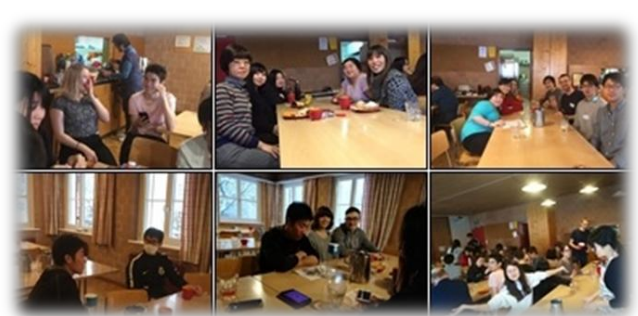
フリータイム (交わり・会話の時)